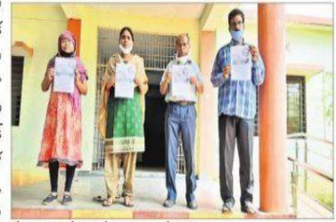
ఘోషార్యులు ప్రదర్శనస్తున్న అధ్యక్షులు

మురళీసగర్: మహిళల హక్కుల పరిరక్షణకు ప్రతి ఒక్కరూ సహకరించాలని మహిళా అధ్యక్షులు కోరారు. ఆఖిల భారత మహిళా నిరసన దినోత్సవాన్ని శుక్రవారం కంచరపాలెం ప్రభుత్వ పాలిటెక్నిక్ కాలేజీలో నిర్వహించారు. మహిళలకు ఉపాధి, భద్రత కల్పించాలని, ప్రజాస్వామ్య హక్కుల పరిరక్షించాలని వారు ఘోషార్యలు ప్రదర్శించారు.